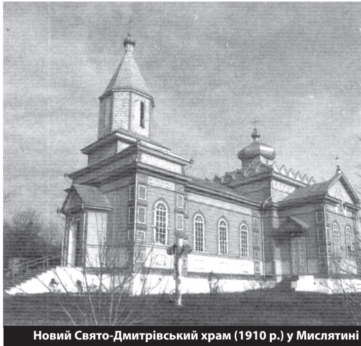
Новий Свято-Дмитрівський храм (1910 р.) у Мислятині