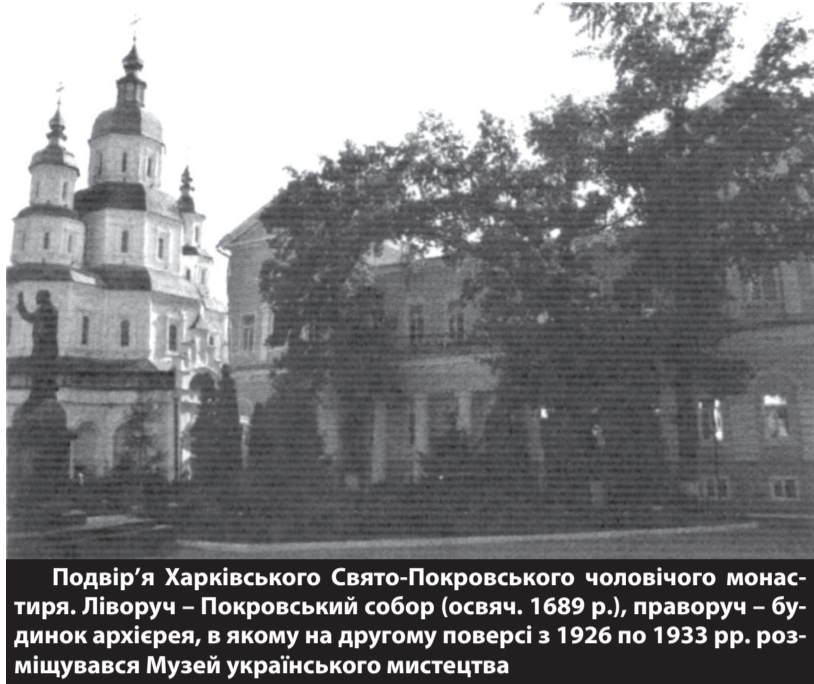
Подвір'я Харківського Свято-Покровського чоловічого монастиря. Ліворуч – Покровський собор (освяч. 1689 р.), праворуч – будинок архієрея, в якому на другому поверсі з 1926 по 1933 рр. розміщувався Музей українського мистецтва